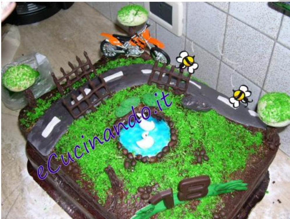
Gli alberi, il masso e i mucchietti di pietre sparsi quà e là.