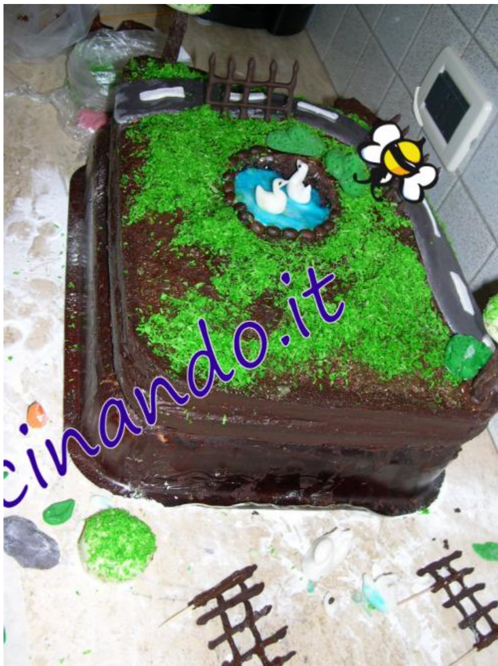
Ecco gli steccati.